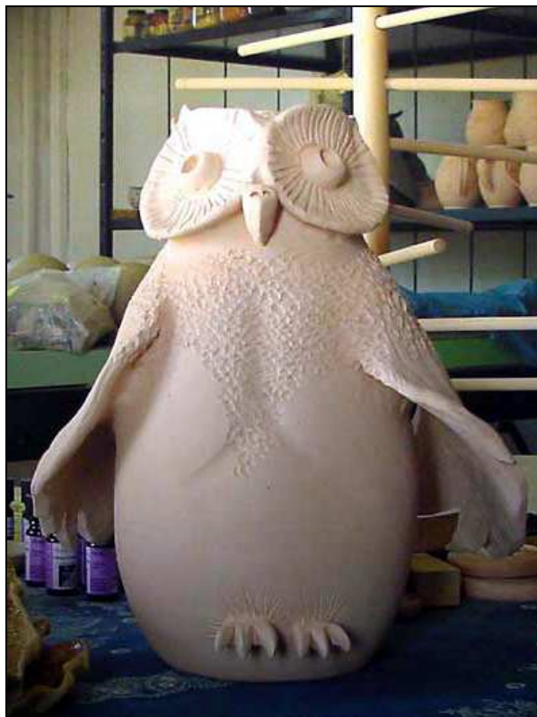
Eule aus der Keramikwerkstatt Reitwein

leihe, Fahrradabstellplätze und Busanbindung. Die Wanderwege sind gut ausgeschildert, verschiedene Informationstafeln aufgestellt und Bänke laden zum Verweilen ein. Und wer dann noch die Adonisröschen an den Trockenhängen oder die Sumpfdotterblumen im Bruch, den Pirol oder Storch in der Luft und einen Sprung Rehe auf den Feldern sieht, der weiß: Hier ist eine der „Perlen des Oderbruchs“!